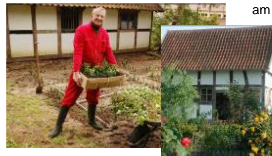
Anlage Schulgarten am Museum